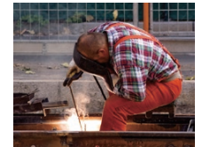
現場の状況を写真で撮影し、送信。バックオフィスが総合的な状況判断に活用