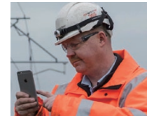
修理・部品調達などの優先順位・指示を通知